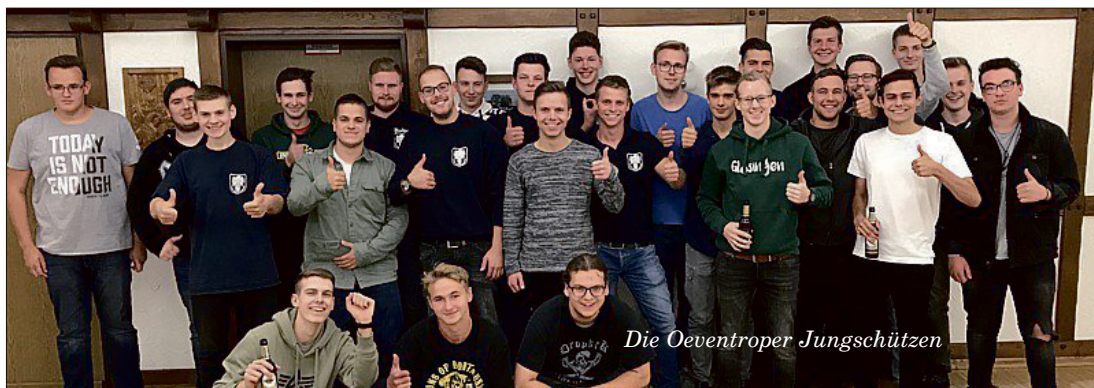
Die Oeventroper Jungschützen

Kontakt: info@korsaren-oeventrop.de 0170 8085542